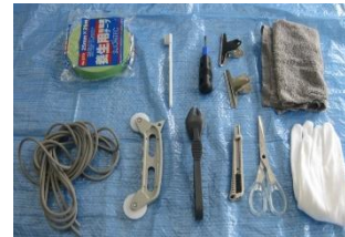
これまでの「網戸の張り替え講座」の様子 網戸張りに便利な道具もご紹介！